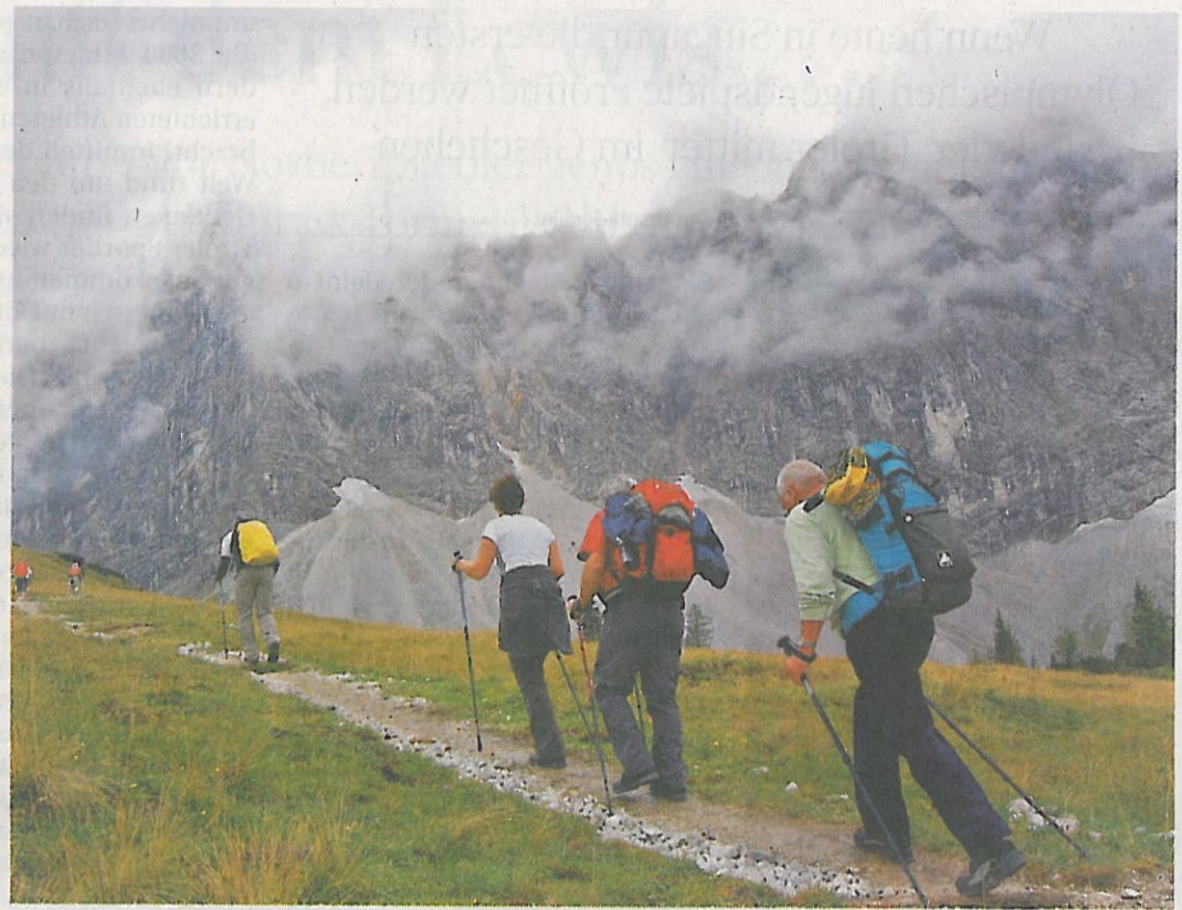
Die Teilnehmer des Karwendelmarsches bewegen sich in einer traumhaften Kulisse.

Neu als Partner gewonnen werden konnte das Traditionsunternehmen Tiroler Steinöl. Schon seit über 100 Jahren wird am Achensee Steinöl als Grundprodukt für hochwertigste Naturprodukte für den Bewegungsapparat, die Körperregenerierung und Körperpflege gewonnen und verarbeitet. Die Teilnehmer des Karwendelmarsches kommen heuer gleich nach dem Marsch in den Genuss davon: Das Finisher-Paket enthält nämlich u.a. ein Tiroler-Steinöl-Hauttonic sowie einen Verwöhn-Fußbalsam. „Die Wertschätzung für unsere Produkte auf Basis natürlicher Grundstoffe steigt kontinuierlich – daher ist uns die Unterstützung des Kar-