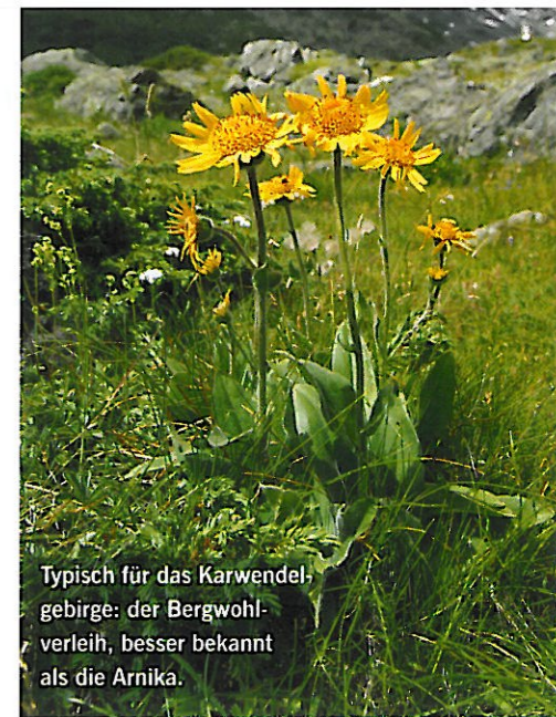
Typisch für das Karwendelgebirge: der Bergwohlverleih, besser bekannt als die Arnika.

Die eigentlich regendichte Kleidung ist von Feuchtigkeit durchzogen. Meinen Mitwanderern scheint es ähnlich zu gehen.