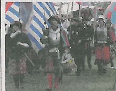
Der „Stählerne Haufen“ veranstaltet heuer wieder ein Mittelalterfest.