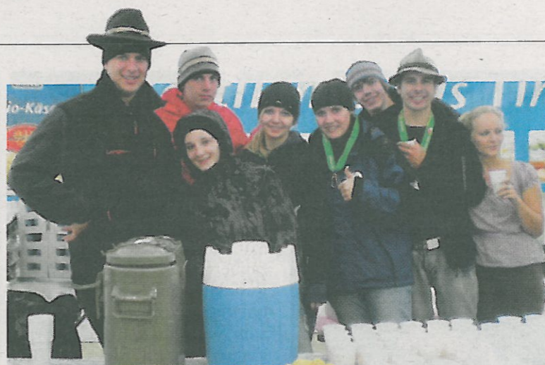
Ein besonderes Erfrischungsgetränk wird angeboten.

Als Dankeschön für die heurige Honigernte findet am Sonntag 28. August, ab 10 Uhr, beim Ambrosiusmarterl in Schwendau/Sidanbrücke ein Imkerfest statt. Alle Bienen- und Imkerfreunde sind dazu herzlich eingeladen. Nach der HI. Messe um 10.30 Uhr, gibt es ein gemütliches Beisammensein mit Grillspezialitäten und selbstgemachtem Kuchen und Kaffee. Honigprodukte werden natürlich auch zur Verkostung angeboten. Für die musikalische Umrahmung sorgen die Jungen Hippacher Musikanten.